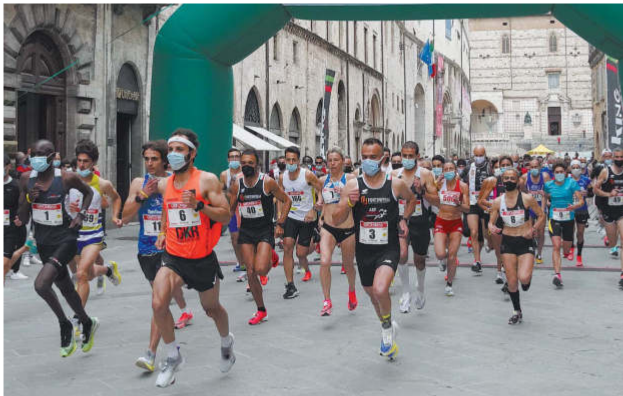
Lo sport riparte A Perugia si è svolta la 40esima Grifonissima con 500 atleti → alle pagine 9, 32 e 33 Busiri Vici, Fiorucci e Pioppi